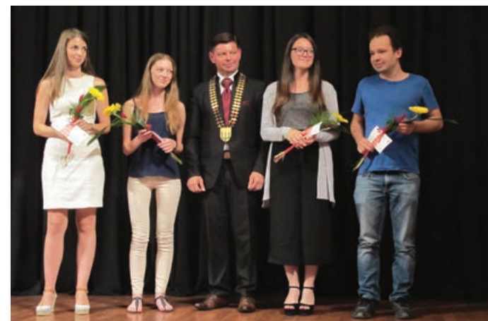
Nagrajeni najboljši dijaki in študenti