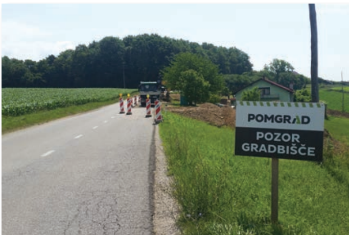
Po zaključku sanacije plazu Jurovski Dol 2 se je pričela sanacija plazu Jurovski Dol 3.