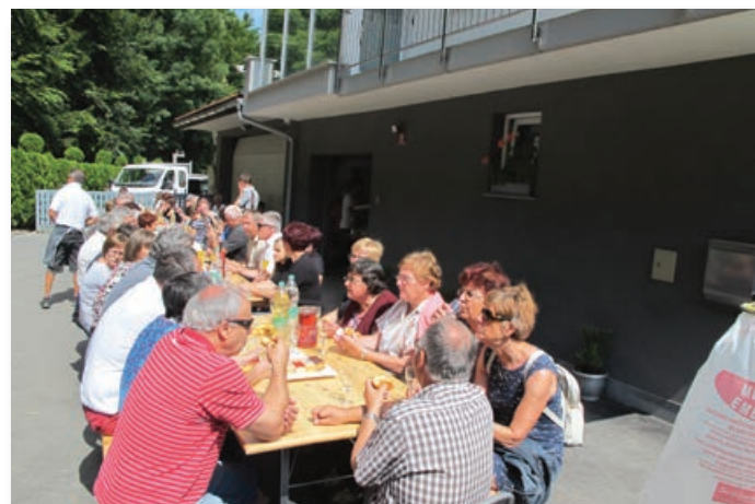
Občanke in občani ob meji dveh občin so bili nove ceste zelo veseli, zato so po njeni otvoritvi pripravili družabno srečanje, na katerem so se zbrali domala vsi domačini.

jo na občino v Gornjo Radgono, k maši pa v Benedikt. Do izgradnje nove ceste je bila cesta v obeh občinah makadamska, čemur je po besedah obeh županov botrovala njena lega na robu obeh občin.