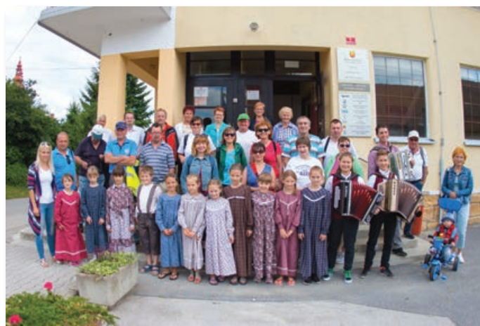
Zbirališče in kulturni program pred kulturnim domom v Sveti Trojici, foto: Maksimiljan Krautič

Galeriji Danija Vrečiča, ogledali smo si oba kamna sredi vasi, ki imata pomembni zgodbi: eden iz kamnoloma v Oseku, drugi literarni, pred samostanom smo se srečali s patrom Bernardom, ki je vsem udeležencem razdelil zloženko ob obnovi trojiške cerkve. Po stopnicah smo se spustili do Trojiškega jezera in do kmetije Senekovič, kjer so nas (kot vedno) prijazno sprejeli z domačo malico. Senekovičevi so rešili propada vrata viničarije, kamor je