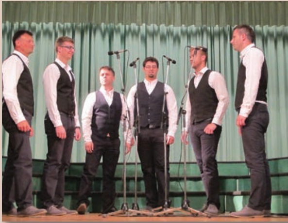
Na Orfejevi pesmi so nastopili tudi Slovenskogoriški glasovi.