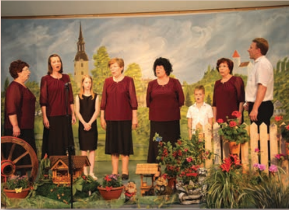
Ena izmed skupin, ki je dosegla regijski nivo, je tudi skupina ljudskih pevcev Žitni klas KD Benedikt.