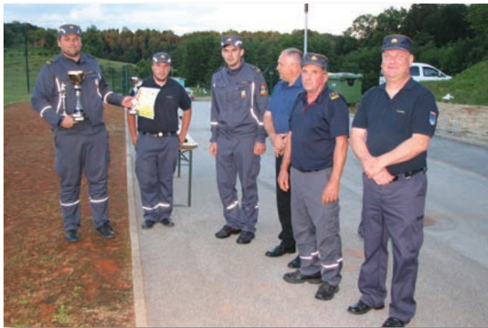
Desetar članov PGD Sveta Ana je prejel pokal za prvo mesto drugo leto zaporedoma.

venja vas in na tretje PGD Razvanje. Pri starejših članicah je prvo mesto doseglo PGD Šalek,