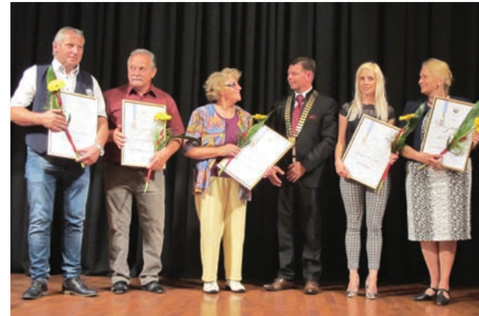
Dobitniki priznanj župana