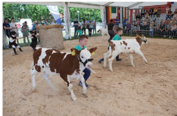
Utrinek s tekmovanja v vodenju teličk za pokal Liska

vedorejsko društvo Slovenske gorice Lenart in KGZS Zavod Murska Sobota. Na razstavi je bilo prikazanih 85 krav lisaste pasme, plemenski bik Divac iz Osemenjevalnega centra za lisasto pasmo KGZS Zavoda Ptuj in dva bikca v starosti 9 in 11 mesecev mesnega tipa lisaste pasme. Živali so na razstavo prispele tako rekoč iz celotne Slovenije, saj je lisasta pasma zastopana povsod v državi. Na nekatera