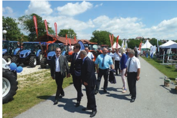
Ugledni gostje na ogledu sejma