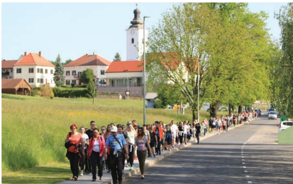
Tako kot pretekla leta je bilo tudi letošnje praznovanje praznika občine Sveti Jurij v Slovenskih goricah sklenjeno s tradicionalno množično prireditvijo Šport špas.