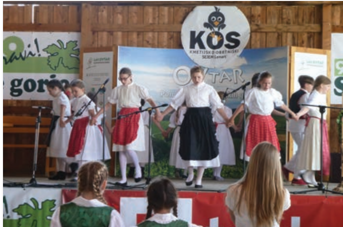
Mladi folkloristi iz hrvaške občine Donja Voča. Ob njih so ob ljudskih godcih in ljudskih pevkah nastopili tudi hrvaški recitatorji.