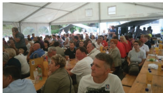
Šotor na dvorišču OŠ Gornji Petrovci je bil poln do zadnjega; brigadirji so prišli iz vse Slovenije.

kaj zgodi, ki bi ponovno dale mladim priložnost za delo in sanje.