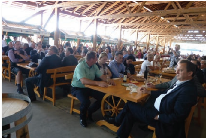
Številni ugledni gostje iz sosednjih držav, slovenskih institucij, sosednjih občin, Lenarta, razstavljalci in obiskovalci na otvoritvi sejma