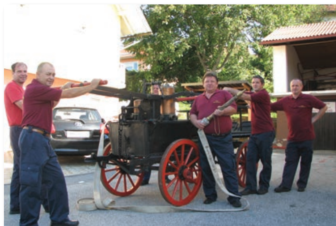
Benediški gasilci so ponosni na svojo staro ohranjeno brizgalno.