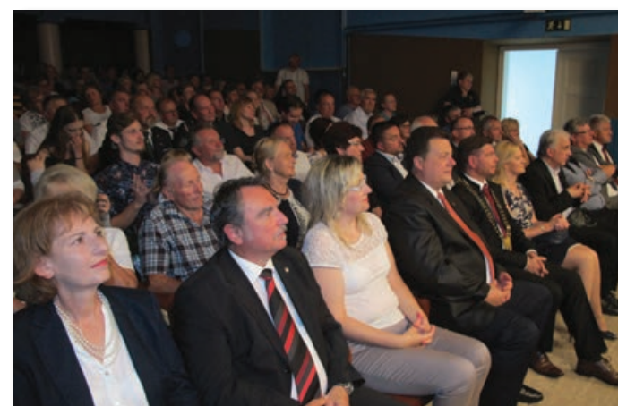
Dvorana Kulturnega doma v Sveti Trojici je bila polna do zadnjega kotička.

kar se kaže v zmanjševanju sredstev za občine nasploh in v težnjah za ukinjanje malih občin oziroma za njihovo združevanje v večje občine, ki bodo politično lažje obvladljive. »Ob-