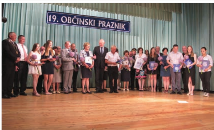
Prejemniki občinskih in županovih priznanj in nagrad so se fotografirali s predsednikom državnega zbora Milanom Brglezom.