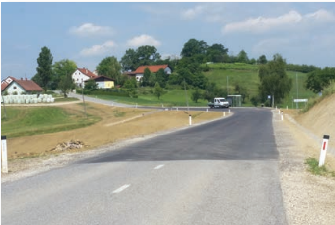
Zaključek sanacije plazu Jurovski dol 2

V občinski upravi se nadejajo, da v kolikor bo vse potekalo po načrtih, bi se v tem kalendarjem letu pričela tudi sanacija Partinjskega plazu. Prav tako po načrtih potekajo rekonstrukcijska dela na Gasterajski cesti.