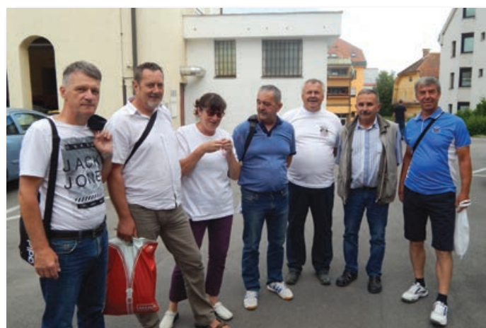
Pred odhodom na Goričko na dvorišču občine

Slišati je bilo celo ideje, da je čas za ponovne akcije, ki premaknejo stvari z mrtve točke in se