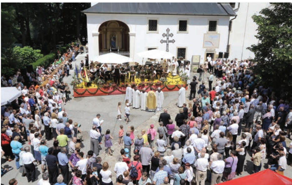
Na blagoslovitvi zvonikov cerkve v Sveti Trojici se je zbralo zelo veliko vernikov, faranov in krajanov iz celotnega območja osrednjih Slovenskih goric.

April in del maja sta bila v znamenju 11. praznika občine Sveti Jurij v Slovenskih goricah. Jurjevi dnevi so se zvrstili od 1. aprila do 20. maja, ko so se iztekli s Šport špasom - tradicionalnim dnevom druženja in gibanja vseh generacij - 20. maja. Od 27. maja do 18. junija so potekale prireditve ob 11. prazniku občine Sveta Trojica v Slovenskih goricah. Še posebej jih je zaznamovala blagoslovitev obnovljenih treh zvonikov znamenite trojiške cerkve ob kvaternici 11. junija. Osrednji dosežek ob 19. prazniku občine Cerkevjak, ki ga proslavljajo od 2. junija do 2. julija, je bilo odprtje obnovljene regionalne ceste z novim pločnikom in javno razsvetlavo 16. junija. Prireditve ob 18. prazniku občine Benedikt potekajo od 30. junija do 9. julija, Anin teden, s katerim bodo praznovali 19. praznik občine Sveta Ana, pa bo potekal od 11. do 26. julija. V občinah osrednjih Slovenskih goric so počastili tudi 25. junij - dan državnosti.