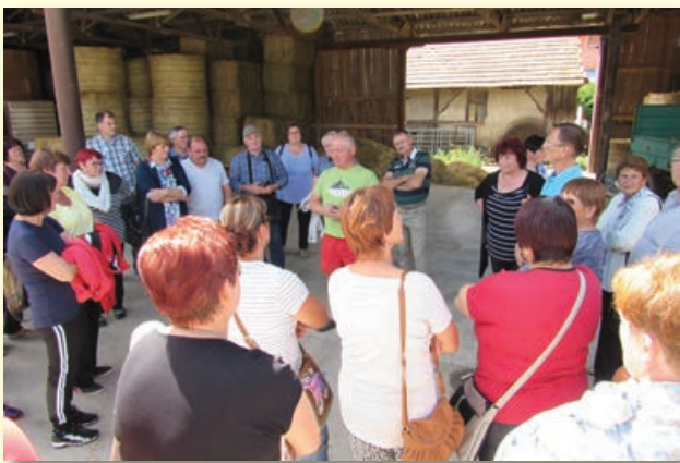
Predstavitve na kmetiji Flis - Četina