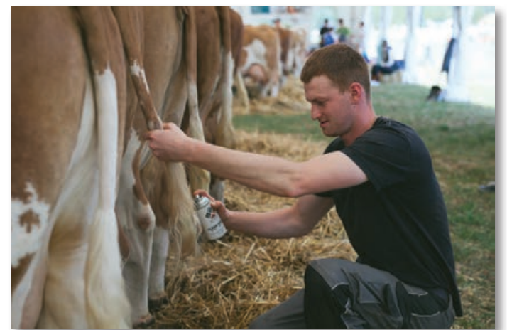
Še zadnji popravki pred "nastopom"