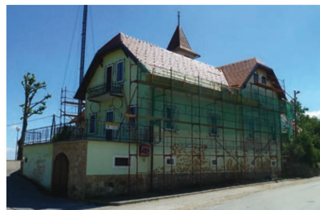
Maistrova vila dobiva novo fasado

Rekonstrukcija državnih cest je velikega pomena, seveda pa je s strani občine Lenart bilo potrebnih veliko prizadevanj na ministrstvu