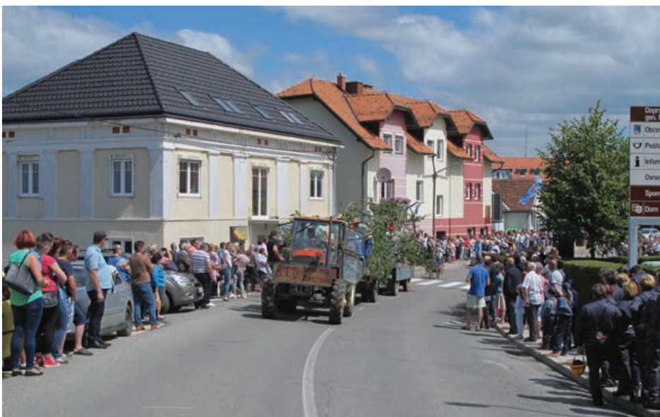
Pred osrednjo proslavo ob prazniku občine Cerkevjak je turistično društvo pripravilo povorko starih navad in običajev skozi središče kraja, na kateri se je zbralo veliko obiskovalcev od blizu in daleč.