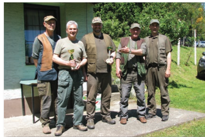
Najboljša ekipa LGB Lenart – strelci LD Sv. Jurij