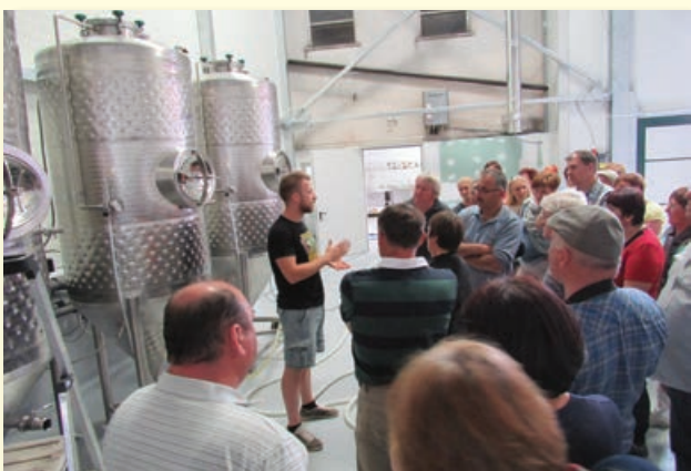
V mikropivovarni družine Rojnik

iz konoplje. Nato smo se odpravili na kosilo k Ribniku pri Lisjaku, ki se nahaja na gozdni jasi v Taboru pri Vranskem. Sledil je ogled kmetije Flis - Četina, ki je usmerjena v pridelavo mleka. Kmetija je od leta 2007 posodobljena z robotom za molžo krav, s tem pa se je rodila tudi ideja o predelavi mleka. Na kmetiji so nam predstavili pridelavo in predelavo mleka s pokušino različnih domačih mlečnih izdelkov: različne vrste jogurtov, sirov in mlečnih napitkov. Na koncu smo se odpravili še čez cesto k sosedom na kmetijo Rojnik, ki se že od leta 1880 ukvarja s pridelavo hmelja. S pridelavo zelenega zlata na 41 hektarjih spadajo med večje evropske hmeljarje. Lani so odprli tudi svojo mikropivovarno Green gold brewing, kjer smo poizkusili pravo domače nefiltrirano pivo. Na poti proti domu smo se ustavili še v Žalcu na Fontani zelenega zlata kot prvi fontani piva na svetu.