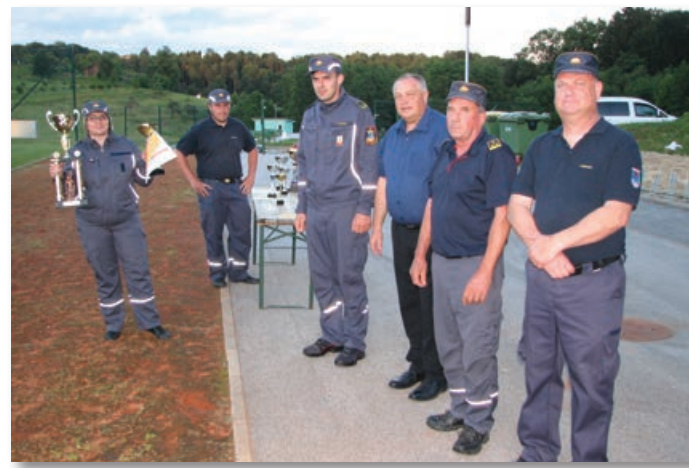
Pokal je prejela tudi desetarka članic PGD Sveta Ana. Na Sveti Ani pa bodo do prihodnjega (26.) gasilskega tekmovanja za Pokal Slovenskih goric hranili tudi dva prehodna pokala.