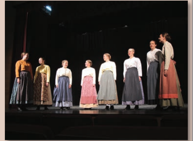
Na regijskem srečanju odraslih folklornih skupin je nastopila tudi mladinska folklorna skupina Jurovčan KD Ivan Cankar Jurovski Dol.