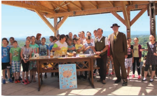
Tudi osnovnošolci iz OŠ Sveta Ana so obiskali lokalne čebelarje.

Čebelarstva zveza Slovenije je v sodelovanju s čebelarskimi društvi in čebelarji organizirala Dan odprtih vrat slovenskih čebelarjev. Letos je odprlo vrata več kot 150 čebelarskih društev, kar pomeni, da gre za najbolj množično predstavitev čebelarstva, kar jih je bilo v Sloveniji. Dan odprtih vrat slovenskih čebelarskih društev je potekalo v petek, 9. junija 2017.